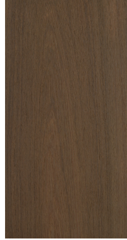
BQ T703 Dark Tan