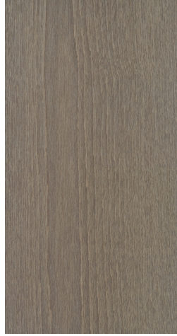
BQ T702 Dark Titanium