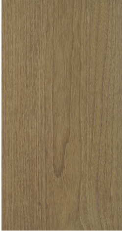
BQ T701 Warm Clay